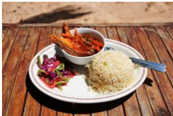
Lunch med Fisk

Här kommer du få riktigt god & vällagad mat av en professionell kock. Det ingår 3 mål mat om dagen, alla dagar i veckan. På helgerna ordnar man sin egen frukost med det som finns i kylan och skafferiet. Frukosten består vanligen av te (chai), kaffe, färskpressad juice, bröd och/eller pannkakor och färska frukter. En typisk lunch består