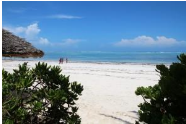
Stranden i Matemwe

På vår partnerskola i Matemwe på Zanzibar kan du få arbeta med barn från 4-6 år (nursery) eller med ungdomar som är 15-25 år. Grundarna är ett otroligt mysigt Zanzibariskt par med rötter från Indien. Skolan ligger 50 meter från stranden, hur ofta får man exempelvis möjlighet att hålla engelskundervisning med havsutsikt? Många har inte råd att låta sina barn gå i statliga skolor men på denna privata skola är undervisningen helt gratis för eleverna. Skolan finansieras med grundarnas egna medel samt två strandvillor som Finns för uthyrning till semesterfirare.