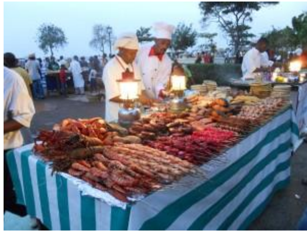
Matmarknaden i Stone Town

På din fritid, vanligen kvällar och helger, kan du utforska din omgivning. Stone Town är den största staden med marknader, hotell, flera internetcaféer och många restauranger och butiker. Förutom stranden du bor vid finns andra vackra stränder på Zanzibar, såsom Nungwi och Kendwa i norr och Paje i söder. Att dyka eller snorkla är verkligen att rekommendera. Ett av de finaste ställena ligger strax utanför stranden du bor vid, den lilla ön Mnemba erbjuder otroligt vacker snorkling och fantastisk dykning. Har du tur simmar en delfin eller valhaj förbi!